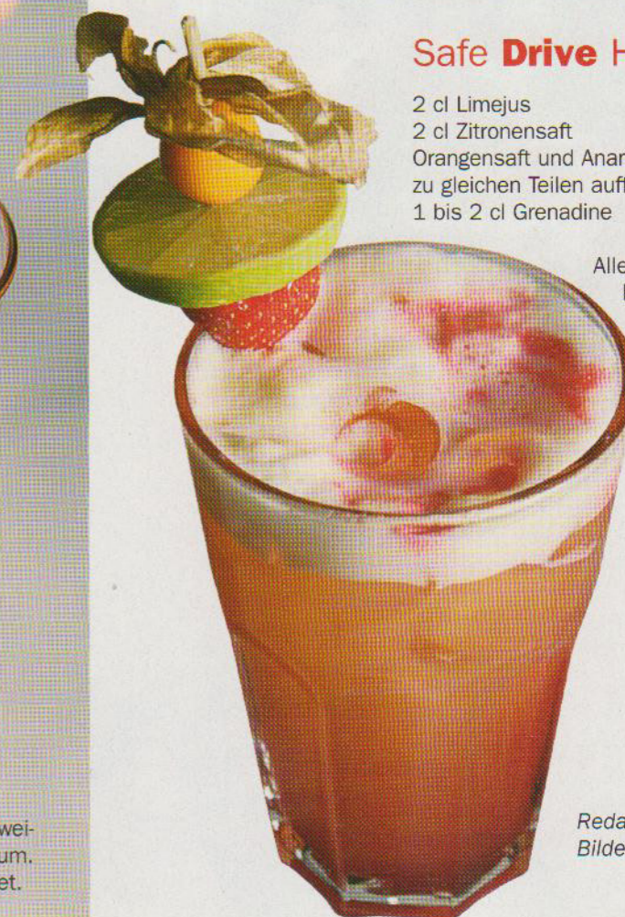
Redaktion: Mario Hees

Alle Zutaten im Shaker kräftig shaken, ins Cocktailglas geben, Grenadine darüber dekorieren.