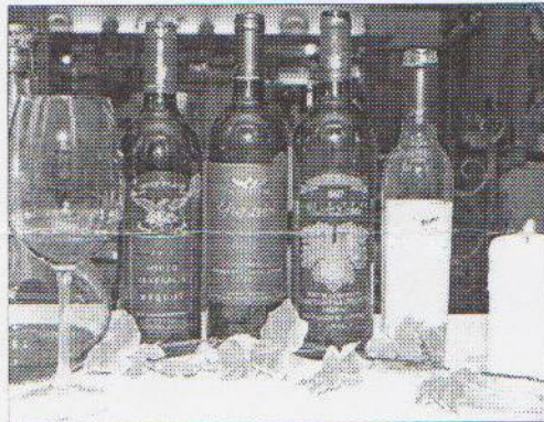
Bei Wolf Blass werden die Weine nach farbigen Etiketten eingeteilt, das erleichtert den Kunden den Griff zur richtigen Flasche. V. l.: Blue Label 2001 (Merlot), «Vaterland»-Tipp Grey Label 1999 (Cabernet-Sauvignon), Seriensieger «Black Label» 97 (Cabernet-Sauvignon, Shiraz, Merlot) und Botrytis Noble Gold 2001 Riesling.

Weitere Infos zum Wein unter: www.wyhus.ch oder Tel. 031/952 71 61.